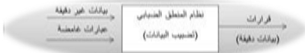
شكل (2-1) نظام المنطق الضبابي

المنطق التقليدي يتعامل مع حالات مؤكدة بشكل قاطع، مثل "هل هذا الكائن حيوان؟". في المقابل، يتعامل المنطق الضبابي مع مفاهيم نسبية أو ذاتية مثل "جميل"، "كبير"، أو "طويل". من خلال استعمال قيم غامضة أو غير دقيقة بدلاً من الحقيقة المطلقة أو الكذب، يهدف المنطق الضبابي إلى محاكاة الطريقة التي يقيم بها الناس القضايا ويتوصلون إلى الأحكام. (Sivanandam & et al., 2007, 75)